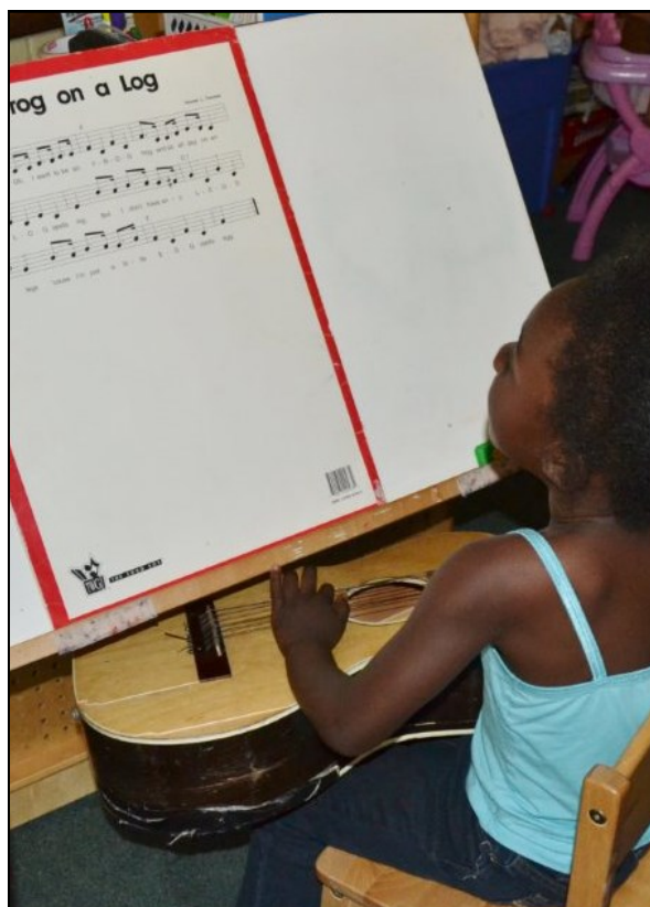
Tiempo de trabajo

“Llena tu casa con pilas de libros, en todos los rincones.” Dr. Suess