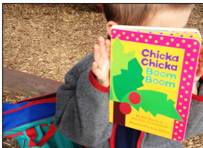
Tiempo al aire libre