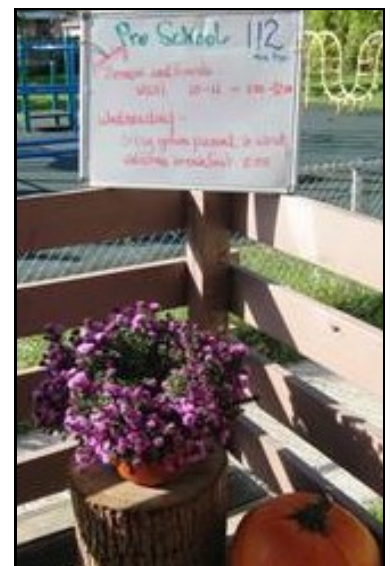
Comunicación de los padres

Estamos contentos de poder ofrecer muchas clases de día completo además de algunos programas de medio día. Los niños están teniendo muchas experiencias nuevas mientras participan en una rutina diaria estructurada. Firmar cada mañana es una parte de esa nueva rutina. Cada niño tiene una imagen adjunta a su nombre llamada "Enlace de Letra." La imagen está asociada con el sonido inicial en el nombre de cada niño. Los maestros están usando estas de muchas maneras para fomentar el reconocimiento del nombre y el sonido. La comunicación diaria con el salón de clase de su hijo lo mantendrá informado, y le proveerá respuestas a cualquier pregunta que pueda tener sobre lo que su hijo está aprendiendo.