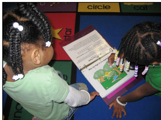
Tiempo de grupo grande

“Llena tu casa con pilas de libros, en todos los rincones.” Dr. Suess