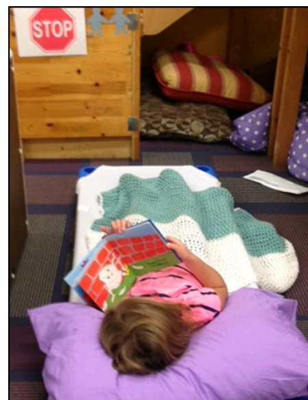
Tiempo de descanso